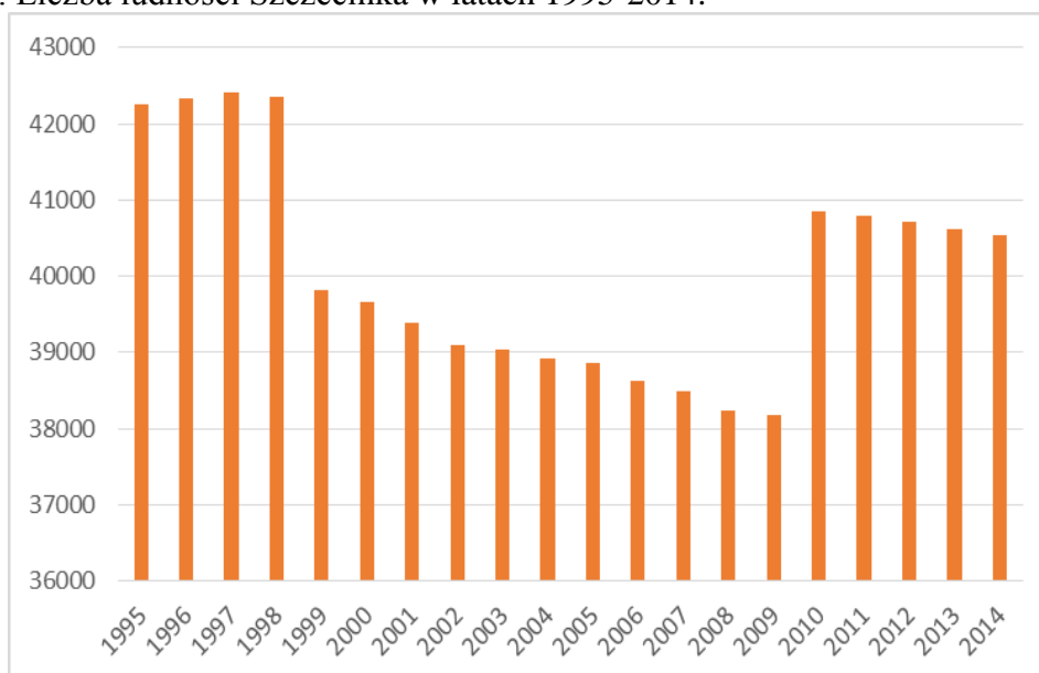
Wykres 2. Liczba ludności Szczecinka w latach 1995-2014.

Źródło: Opracowanie własne na podstawie danych z Banku Danych Lokalnych GUS.