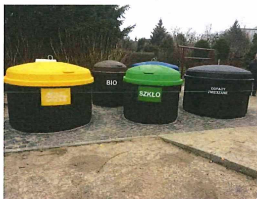
Przykładowe zdjęcia pojemników półpodziemnych wykonanych w 2017 r.