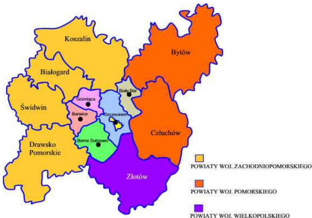
Rysunek 2. Lokalizacja miasta Szczecinek

Powierzchnia miasta wynosi 4845,94 ha, z czego tereny zabudowane i zainwestowane zajmują około 20%, a pozostały obszar to tereny otwarte, użytkowane w różny sposób: wody powierzchniowe, kompleksy leśne, użytki rolne oraz nieużytki i tereny niezagospodarowane.