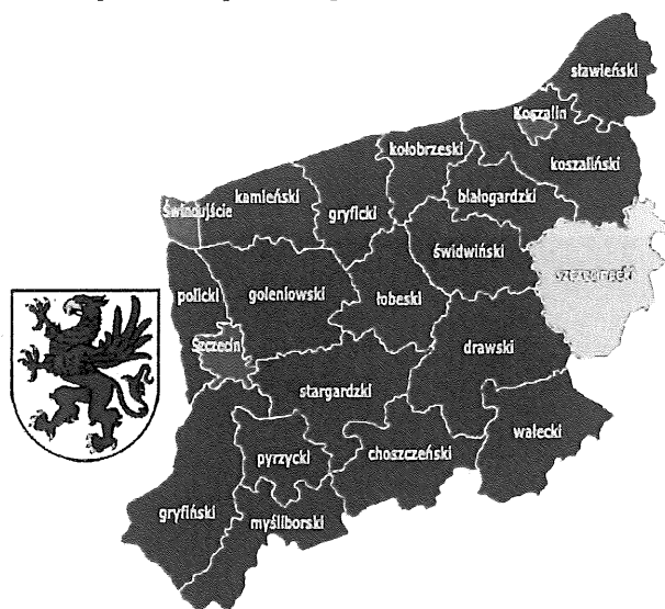
Rys. 1 Administracyjny podział woj. zachodniopomorskiego

Szczecinek to miasto położone w południowo-wschodniej części województwa zachodniopomorskiego na Pojezierzu Drawskim (rys.1), na pograniczu Pojezierza Drawskiego i Pojezierza Szczecineckiego i jest siedzibą gminy miejskiej Szczecinek. Miasto Szczecinek zamieszkuje 38 088 tysięcy mieszkańców (stan na koniec 2016 roku), powierzchnia miasta wynosi 48,46 km 2 , z czego tereny zabudowane i przeznaczone pod inwestycję zajmują około 20%, a pozostały obszar to tereny otwarte, użytkowane w różny sposób: wody powierzchniowe, kompleksy leśne, użytki rolne oraz nieużytki i tereny niezagospodarowane.