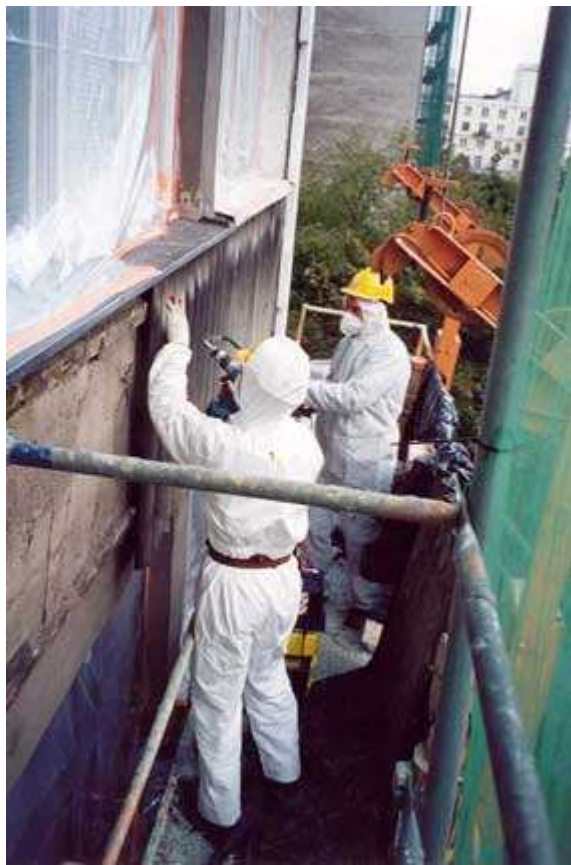
Rysunek 5 Przygotowanie wyrobów azbestowych do transportu: