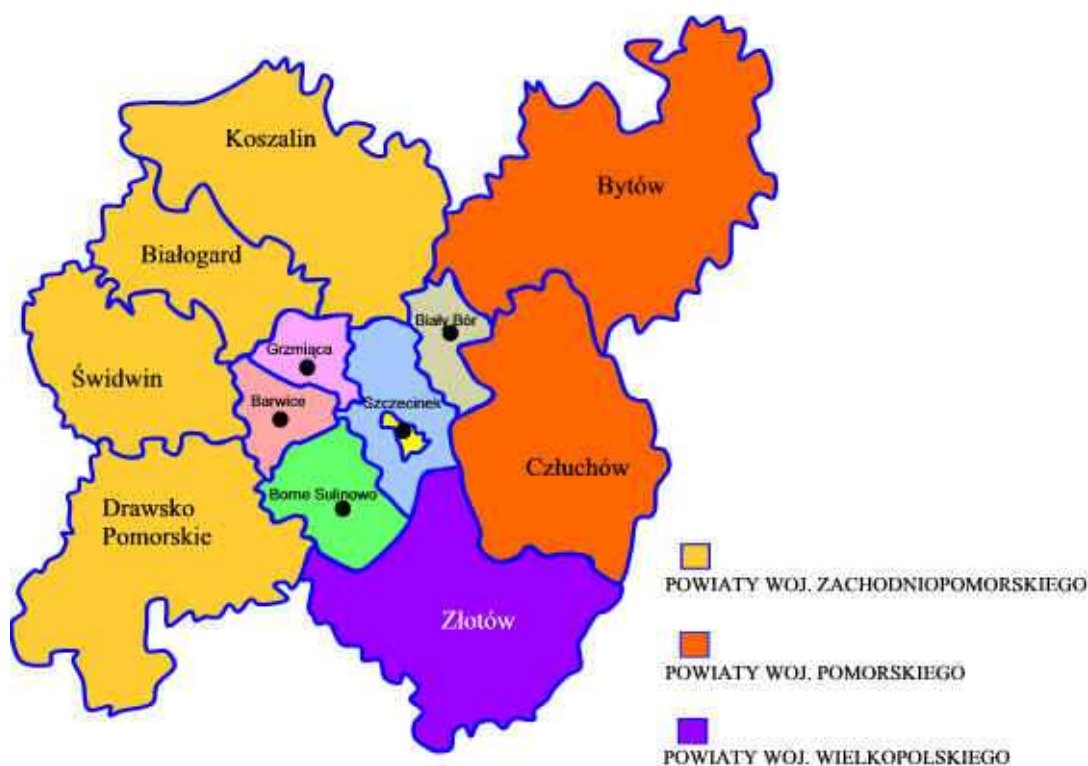
Rysunek 2. Lokalizacja miasta Szczecinek

Powierzchnia miasta wynosi 4845,94 ha, z czego tereny zabudowane i zainwestowane zajmują około 20%, a pozostały obszar to tereny otwarte, użytkowane w różny sposób: wody powierzchniowe, kompleksy leśne, użytki rolne oraz nieużytki i tereny niezagospodarowane.