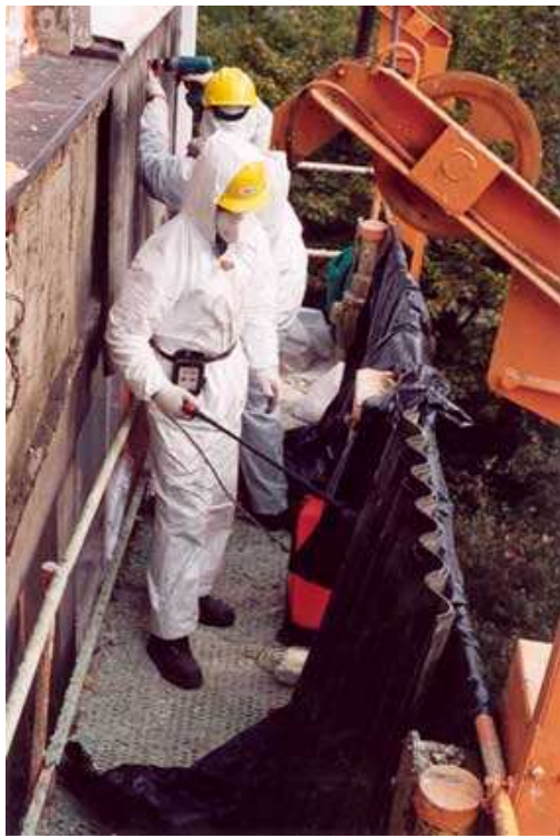
Rysunek 4 Usuwanie wyrobów azbestowych:

Poniżej przedstawiono sposób prawidłowego postępowania przy usuwaniu, demontażu i rozbiórce elementów azbestowych